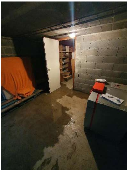
Ill.1 : Cave inondée de la mairie de Thenay (41)

élus municipaux. Sans elles, un pan de l'histoire des bibliothèques est voué à s'écrire sans vestige matériel, voire à être oublié.