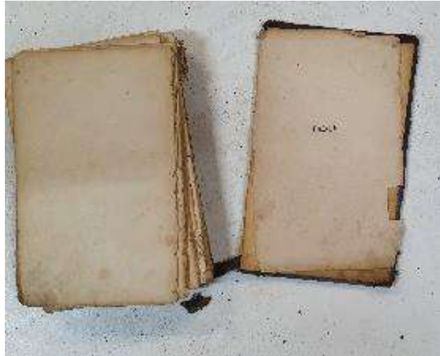
Ill. 3 : Châteauneuf-sur-Loire (45) : ouvrages dégradés