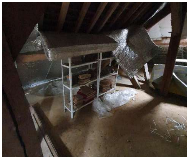
Ill. : Berchères-sur-Vesgre (28) : collection de l'ancienne bibliothèque populaire installée dans le grenier de la mairie