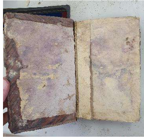
Ill. 4 : Corancez (28) : Ouvrages infestés