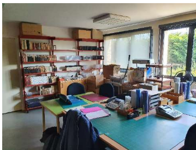
Ill. : Saint-Doulchard (18) : réserve de la bibliothèque