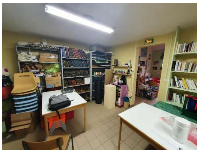
Ill. : Dordives (45) : Réserve de la bibliothèque

Dès lors, plusieurs questions se posent quant à la préservation de ces fonds et documents : est-ce à ces établissements de les conserver alors qu'ils sont résolument tournés vers la lecture publique ? Ne faudrait-il pas les proposer en don à des bibliothèques disposant d'un service patrimoine ? Les collections issues des bibliothèques populaires – qui ne sont pas encore patrimoniales mais qui revêtent un double caractère historique et local – peuvent-elles être valorisées au sein de ces établissements ? Ces questions sont à croiser avec celles qui se posent également pour les collections conservées en mairies.