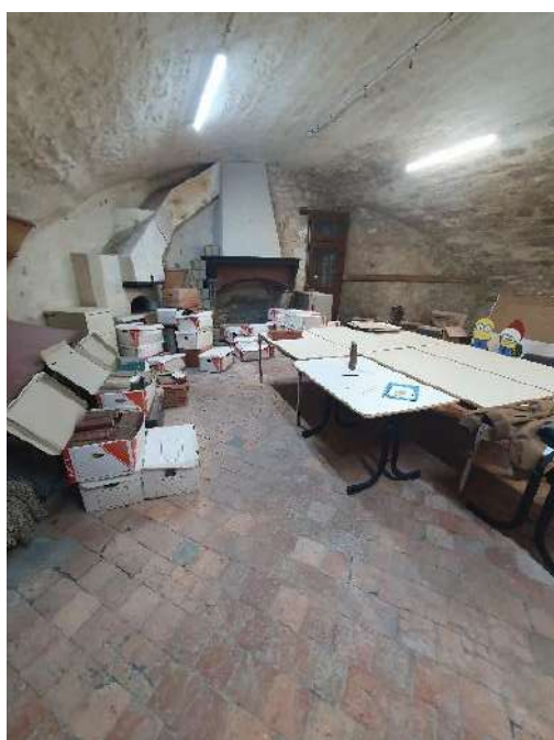
Ill. 2 : Cave de l'hôtel de Ville de Châteauneuf-sur-Loire (45)