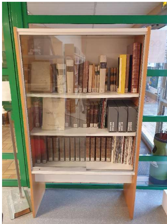
Ill. : Bourgueil (37) : fonds ancien installé dans l'espace public de la bibliothèque